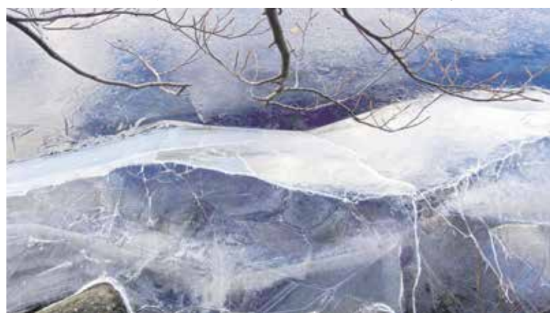
Leden van fotoclub Sociëteit exposeren in het Kerkje in Velp

Vermaeck in Grave en telt 36 leden. Binnen de club staat het ontwikkelen en inspireren als fo-