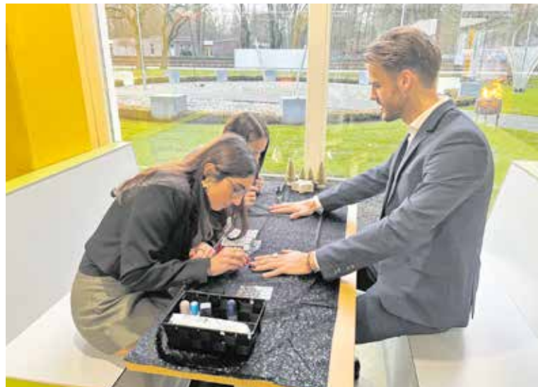
Nog even je nagels laten lakken of op de foto met de kerstman om daarna elkaar een prettige vakantie en fijne feestdagen toe te wensen.

BOXMEER - In de week voor Kerst zetten leerlingen van Mezzo Scholen zich in voor een ander.