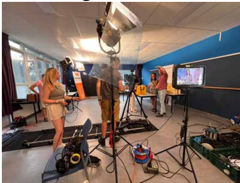
De opnamen vonden plaats in Boxmeer.

BOXMEER - Ongekend Onrecht is een korte film van filmmaker Stef de Hoog, die opgroeide in Boxmeer. De opnamen zijn ook gemaakt in Boxmeer. Met enkele bekende acteurs. Op zondag 2 februari te zien in Boxmeer.