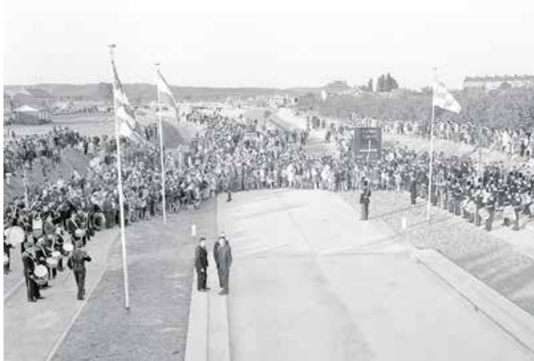
Quizvraag: Welke weg wordt hier geopend in het Land van Cuijk?

LAND VAN CUIJK - Ben jij een echte liefhebber van weetjes en feitjes? En wil je tegelijkertijd een gezellige avond hebben waarbij veel wordt gelachen? Dan is 'De Spijker op zijn kop Quiz' echt wat voor jou!