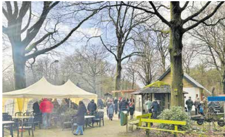
wens dat Pokémons echt gaan leven".

VELP – Zondag 22 december zijn er honderden bezoekers geweest bij de kinderboerderij in Velp. Het slechte weer werd getrotseerd om tussen 13.00 en 16.00 uur de dieren te bezoeken en mee te doen met allerlei activiteiten.