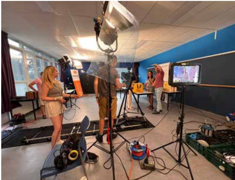
De opnamen vonden plaats in Boxmeer.

BOXMEER - Ongekend Onrecht is een korte film van filmmaker Stef de Hoog, die opgroeide in Boxmeer. De opnamen zijn ook gemaakt in Boxmeer. Met enkele bekende acteurs. Op zondag 2 februari te zien in Boxmeer.