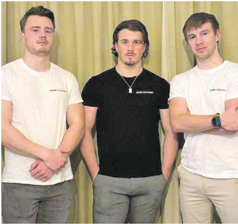
De drie vrienden.

CUIJK - Op 20 december 2024 is uitgekomen een fantasy-boek uitgekomen geschreven door Yannick Versteeg, Yvar te Velde en Thijme Bekx, waarvan de eerste twee in Cuijk geboren zijn en nog steeds wonen.