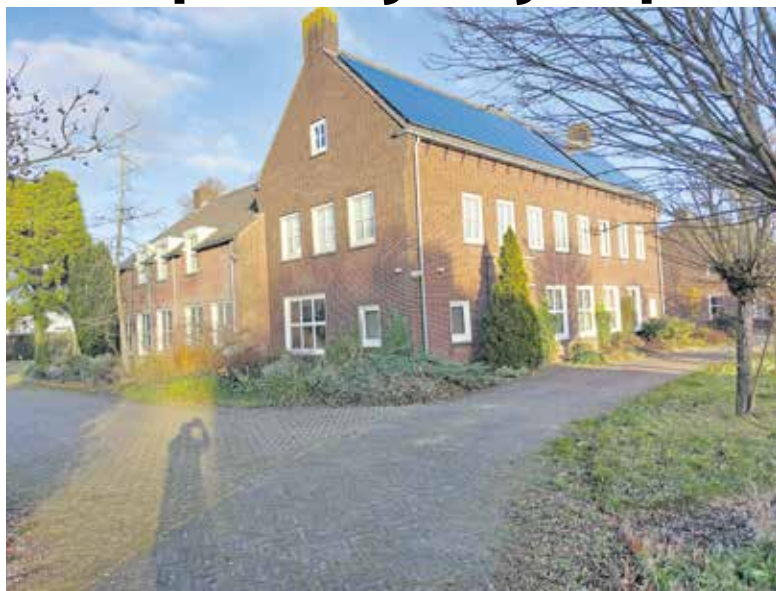
Woongroep vestigt zich in villa aan de Beerseweg in Cuijk.

CUIJK - Na tien jaar praten, zwoegen en tegenslag is het dan toch gelukt: wooninitiatief Kakelbont in Cuijk gaat er komen. Vanaf eind volgend jaar hebben zeven tot negen jong volwassenen met een verstandelijke beperking de beschikking over een ruime eigen kamer met badkamer in een prachtig, gezellig en ruim woonhuis.