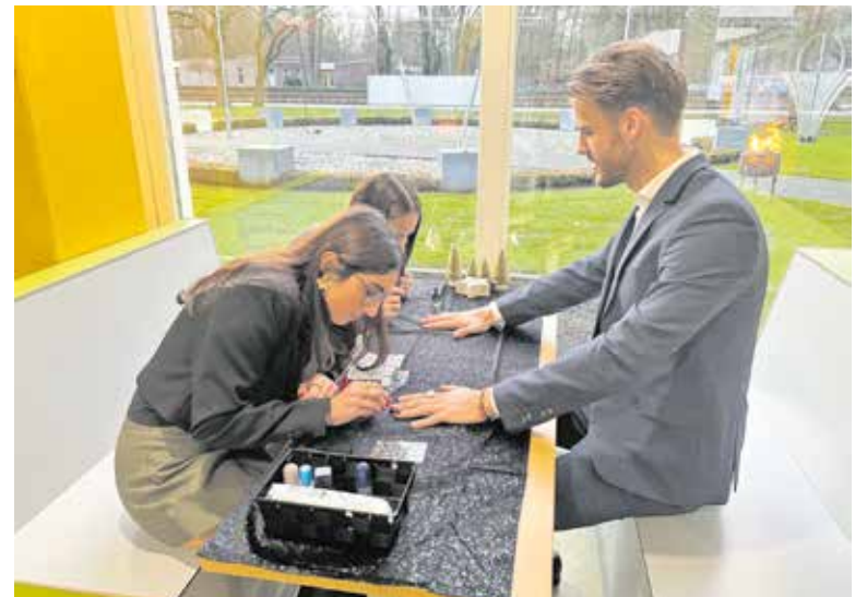
Nog even je nagels laten lakken of op de foto met de kerstman om daarna elkaar een prettige vakantie en fijne feestdagen toe te wensen.

BOXMEER - In de week voor Kerst zetten leerlingen van Mezzo Scholen zich in voor een ander.