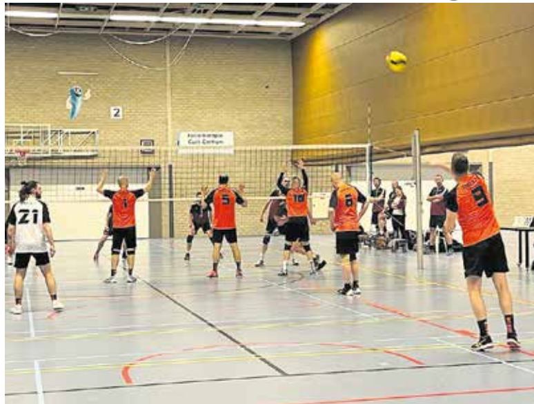
Sportplan gemeente. Ook over volleybalsport.