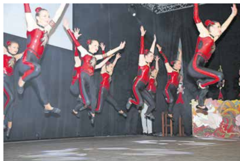
De Zelfkant in Haps met de Zelfkanthenekes

In het weekend van vrijdag 14 en zaterdag 15 februari zijn er nog twee Pronkzittingen. www.debokkerijers.nl