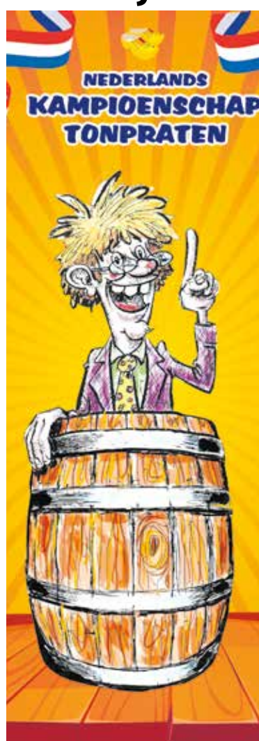
Het NK komt naar Wanroij.

Meer informatie staat op de website www.buutkampioenschap.nl