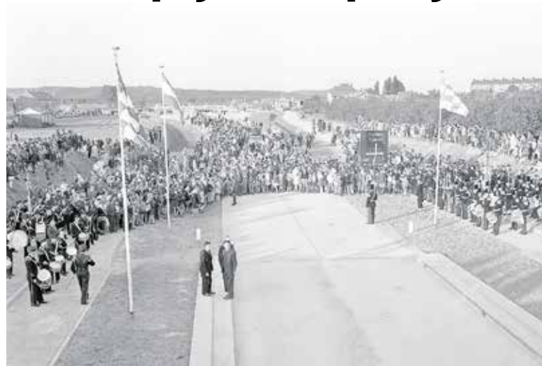
Quizvraag: Welke weg wordt hier geopend in het Land van Cuijk?

LAND VAN CUIJK - Ben jij een echte liefhebber van weetjes en feitjes? En wil je tegelijkertijd een gezellige avond hebben waarbij veel wordt gelachen? Dan is 'De Spijker op zijn kop Quiz' echt wat voor jou!