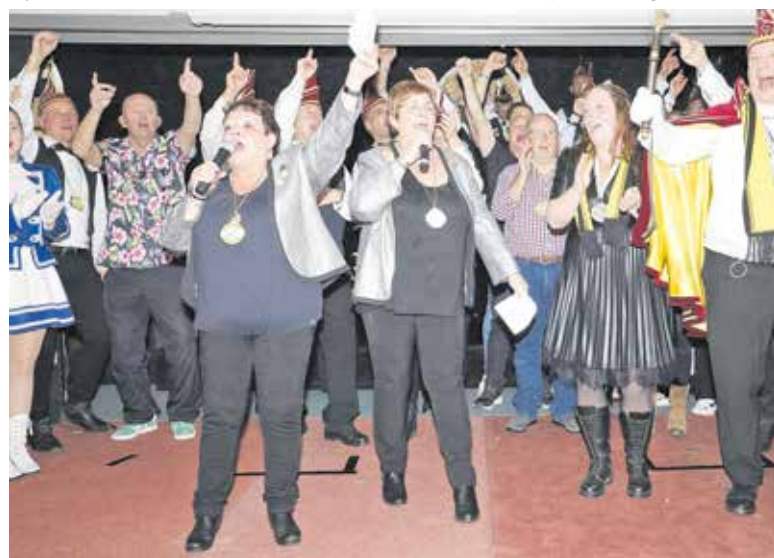
De Bokkerijers in Beers.

Bij de Haonen en Hennen in Haps zijn de zittingen altijd al begin januari. Op Tweede Kerstdag is de voorverkoop van kaarten bij café de Molen. De eerste zit-