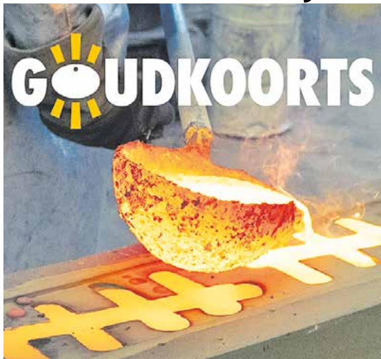
Goudkoorts in Cuijk.

CUIJK - De Kuukse elfkroegtocht gaat voor goud! Of beter gezegd: Goudkoorts wordt hét thema van de 39ste editie. Opzettende lezers hebben in eerdere communicatie wellicht al een glimp van het thema opgevangen.