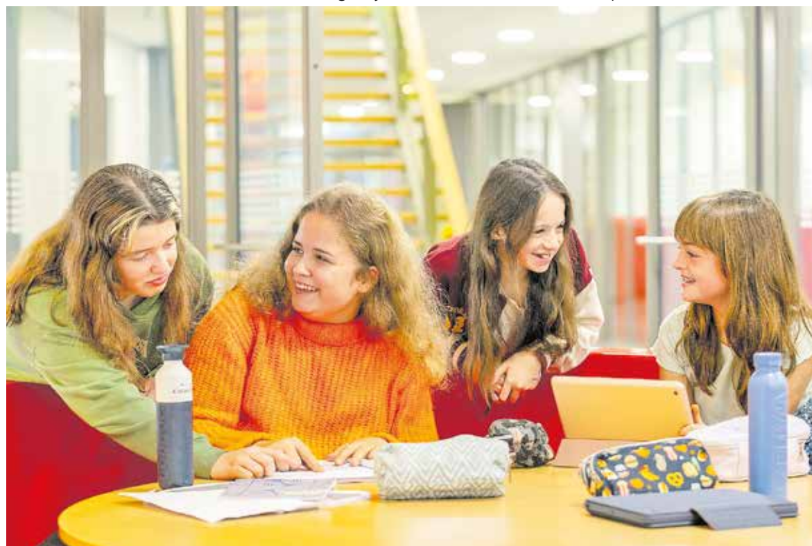
Leerlingen delen hun ervaring met de middelbare school tijdens de informatieavonden aan ouders/verzorgers van groep 7 en 8.