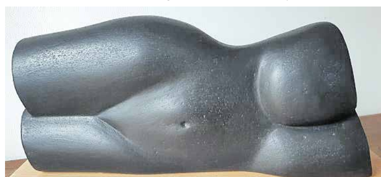
Werk van Leo Rutten.

"Deze expositie is voor mij niet alleen een mijlpaal, maar ook een gelegenheid om mijn passie voor kunst met anderen te delen." Expositie op 1 en 2 februari van 12.00-17.00 in het Pakhuis, Kerkstraat 12 in Cuijk.