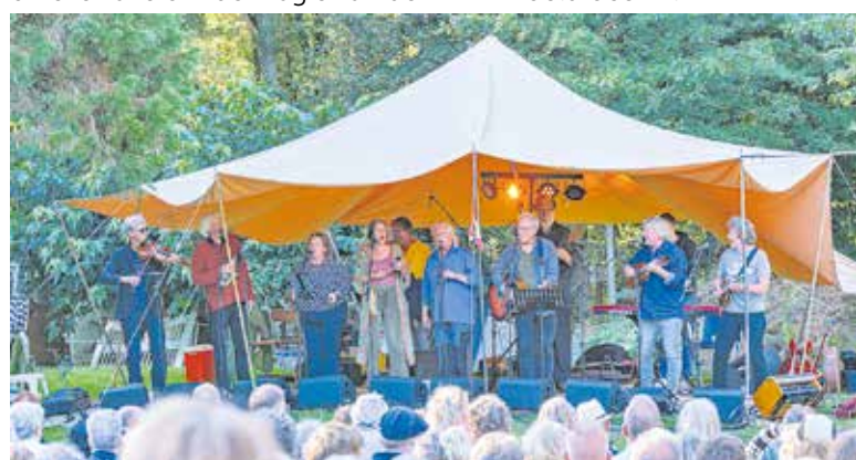
De Veulpoepers 3.0.

Veulpoepers te beleven in Sint Anthonis. Bestel je kaarten snel via de website en zorg dat je erbij bent. Nodig vrienden en familie uit en beleef samen een avond vol muziek, humor en nostalgie! Details op een rijtje: Datum: Zaterdag 1 februari 2025. Tijd: Aanvang 20:30 uur. Locatie: Theaterzaal Oelbroeck, Sint Anthonis. Kaarten: verkrijgbaar via www.oelbroeck.nl