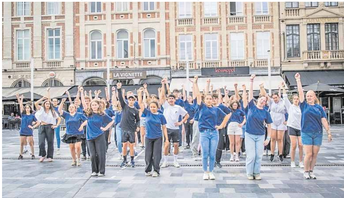
Jongerendagen 2024: Flashmob in Brussel.

Aanmelden kan tot uiterlijk 1 maart bij het bestuur van Linden-groet-Linden via een mailtje aan mienvanhoek@gmail.com met vermelding van leeftijd en woonplaats.