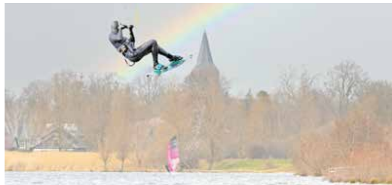
Kitesurfer bij Lindens.

planvorming ligt bij TopParken. De gemeente heeft een faciliterende rol." Bannink: "Kunnen we blijven afwijzen? Het college: "In de samenwerkingsovereenkomst 2021 zijn afspraken opgenomen over de (gefaseerde) realisatie. Binnen drie jaar na ondertekening van de overeenkomst (d.d. 28 mei 2020) moet de ontwikkelaar een uitwerkingsplan voor de eerste fase bij de gemeente hebben ingediend. Indien de ontwikkelaar niet aan voornoemde termijn voldoet heeft de gemeente het recht alle overeenkomsten tussen partijen te beëindigen met inachtneming van een opzegtermijn van drie maanden.