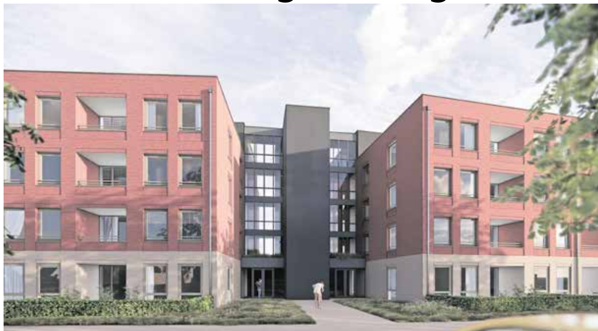
Schets van de appartementen 'Kralensnoer' in Cuijk.

LAND VAN CUIJK - De gemeente, woningcorporaties Mooiland en Wonen Vierlingsbeek en de huurdersorganisaties maken jaarlijks prestatieafspraken. Voor 2025 zijn een aantal belangrijke afspraken gemaakt over het aantal nieuwe huurwoningen, duurzaamheid en leefbaarheid.