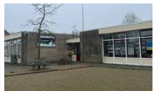
't Stekske, Stevensbeek