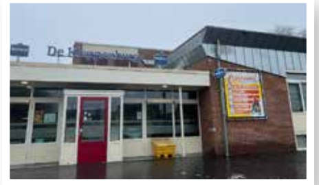
De Kleppenburg, Oeffelt