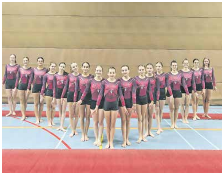
Turnen bij SV Olympia Cuijk: de bovenbouwselectie.

De wedstrijden beginnen beide dagen om 8.45 uur in de ochtend. Op zaterdag 1-2 zijn er vijf ronden en eindigen de wedstrijden om ca 20.00 uur. Op zondag 2-2 zijn er vier ronden en is de laatste wedstrijd om 17.45 uur afgelopen. De beide Cuijkse turnsters komen op zondag vanaf 10.45 uur in actie. Entreegelden: Kinderen t/m 12 jaar 4 euro. Personen boven 12 jaar 7 euro. Leden van Olympia krijgen een gratis kaartje.