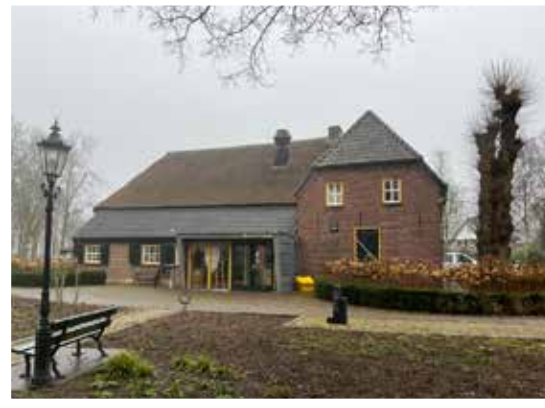
Doehuis Cuijk Padbroek