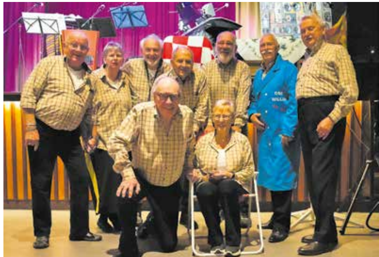
Groepsfoto van Kneut.