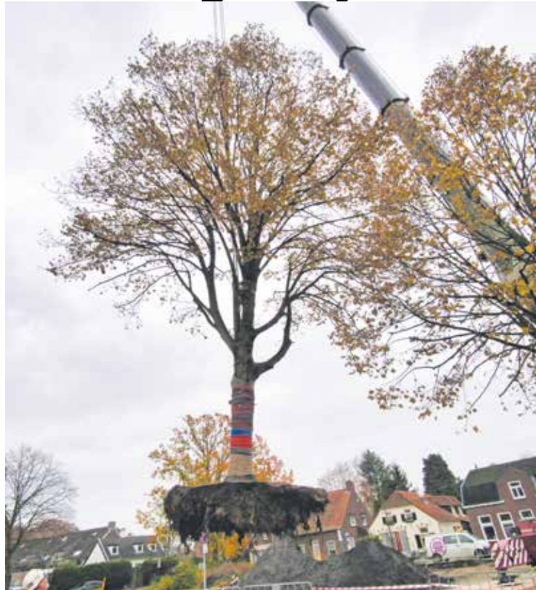
De recente verplaatsing van bomen op het Weijerplein in Boxmeer.