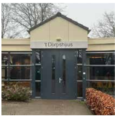
't Dorpshuis, Ledeaeker