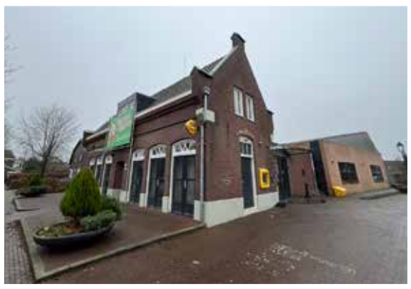
De Oude Heerlijkheid, Oploo