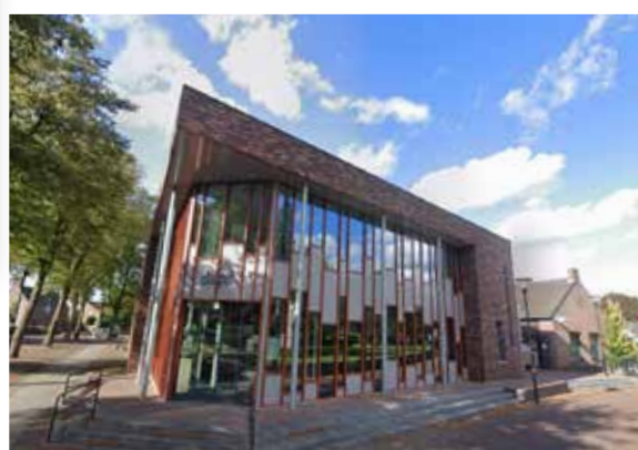
De Pit, Overloon