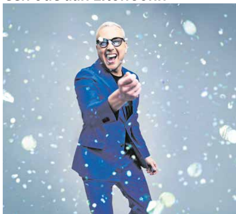
Tribute to Elton John.