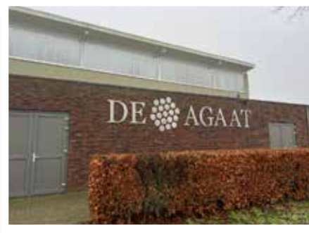
MFA De Agaat, St. Agatha