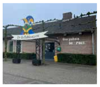
Dorpshuis de Poel, Rijkevoort