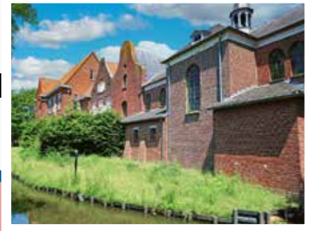
De Weijer, Boxmeer