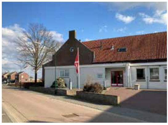
't Akkertje, Vianen