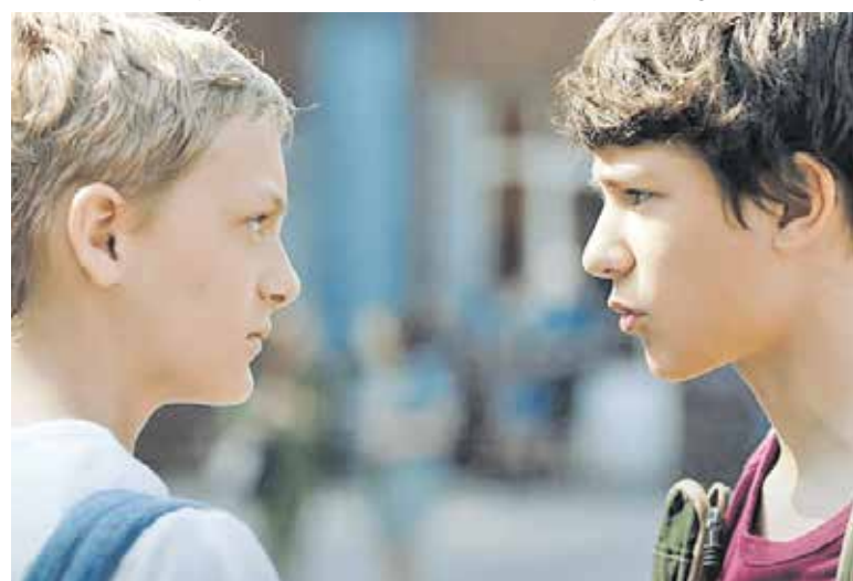
De bekroonde film Close.

Film & Lunch 'Close', vrijdag 7 februari, Bibliotheek Boxmeer (in De Weijer), inloop vanaf 9.30 uur. Losse kaarten kosten €13,50. Kaartverkoop vindt plaats in de bibliotheken en via www.biblioplus.nl/agenda