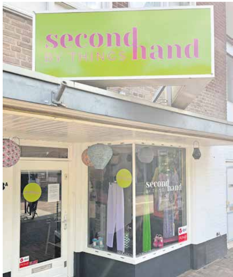
Second Hand by Things in de Korte Molenstraat.

Contactinformatie: Second Hand by Things, Korte Molenstraat 18a in Cuijk, (06) 10946958.