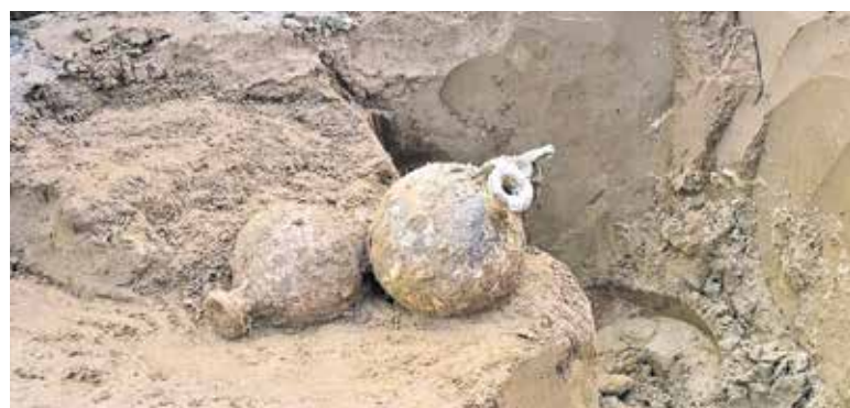
Eerder gedane vondsten uit de bodem in Cuijk.

Waardebepaling wordt niet gedaan. Ook zonder voorwerpen is men van harte welkom. Ter voorbereiding: Laat even weten als u komt met voorwerpen en stuur eventueel een foto van het voorwerp(en) mee vóór 17 februari secretariaat@museumceulcum.nl