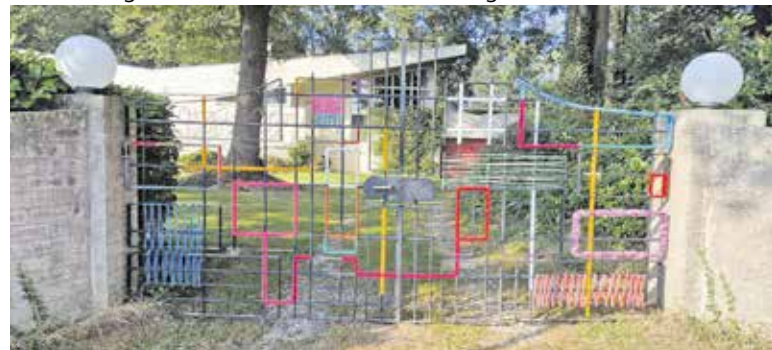
Hekwerk van Madelon Klippert.

Geen uitdaging is te groot, opdrachtgevers kunnen eigen objecten aanleveren die vervolgens worden ingebreed.