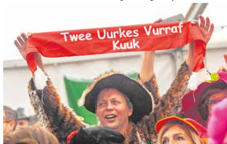
Twee Urkes Vurraf op zaterdag 1 maart.

Beide evenementen op deze Kuukse Carnavalszaterdag zijn gratis toegankelijk.