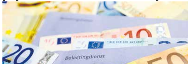
Vrijwilligers helpen bij de belastingaangifte.

Om in aanmerking te komen voor hulp wordt er een inkomensgrens gehanteerd. Voor 2024 zijn die voor een alleenstaande € 37.496 en voor gehuwden/samenwonenden € 47.368 per jaar. In de voormalige gemeente Cuijk worden de aanvragen gecoördineerd door de sector Individuele Belangenbehartiging. Aanvragen kunnen worden ingediend bij de infobalie via telefoonnummer 0485 574440 (keuze 1) of stuur een emailbericht naar IBKBOWOC@gmail.com