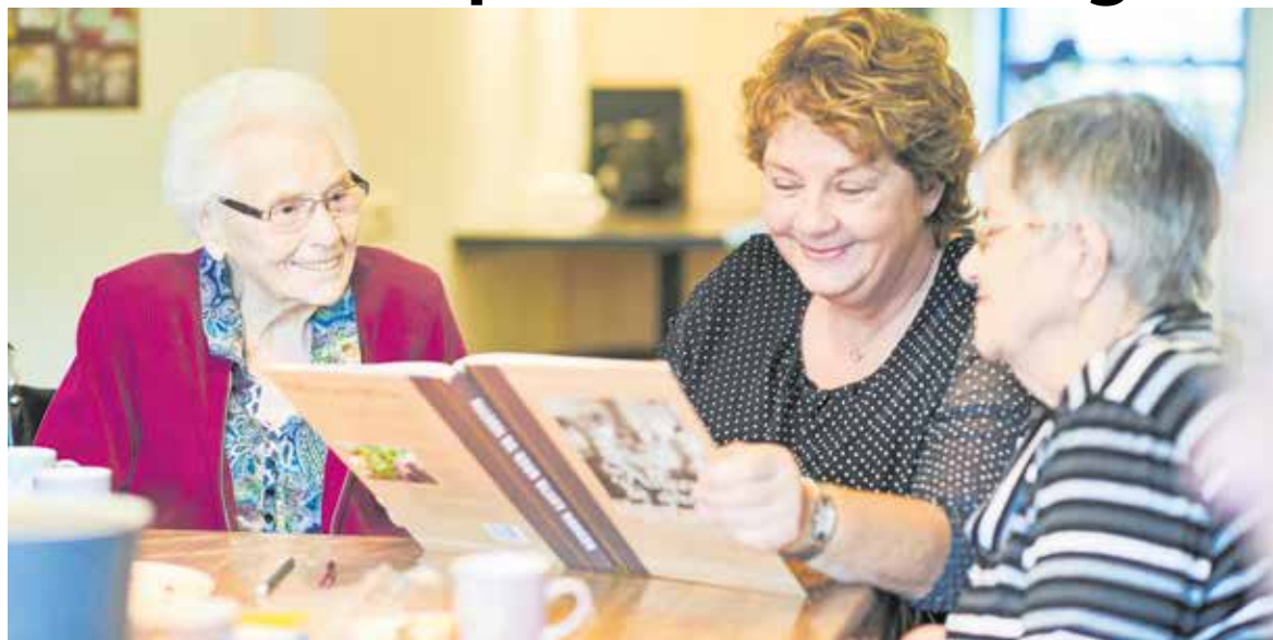
Dementie in Land van Cuijk.