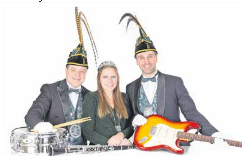
Prinsenhofhouding de Scheresliepers.

De start van de activiteiten in Vianen is vrijdagmiddag 28 februari om 16:00 met de special jongerenmiddag. Zaterdag reist men naar Cuijk voor de carnavalsmis (10.00) en aansluitend de sleuteloverdracht in de Schouwborg. 's Avonds is de themavond in de Hei vanaf 20.00 uur. Het thema is dit jaar Night of the Drag Queens. Zondagmiddag is deelname aan de optocht in Kuuk en een themamiddag voor de jeugd vanaf 16.00 uur. Maandag is de optocht in Vianen vanaf 14.41 met daarna carnavalsbal. Dinsdag een gezinsmiddag vanaf 15.00 uur en