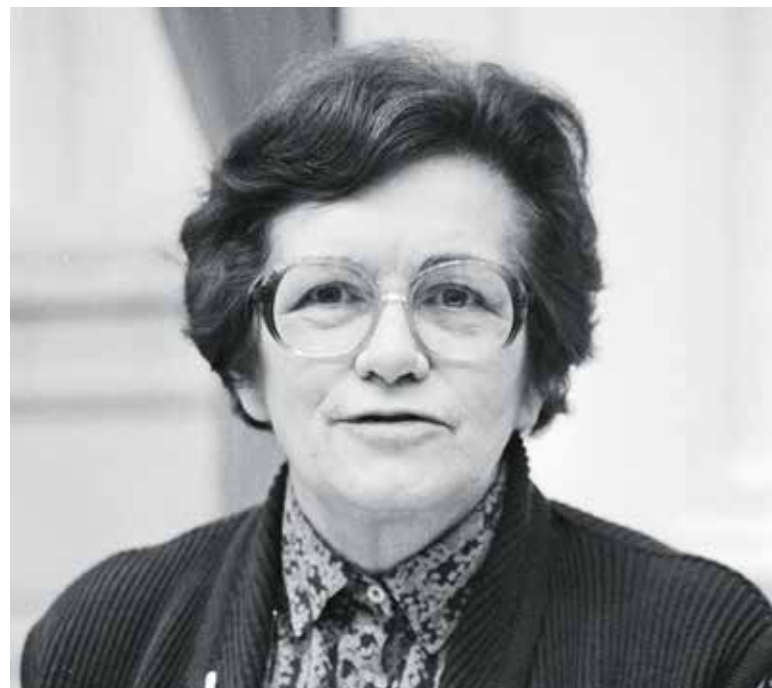
Dinie Cornelissen uit Boxmeer.

te datum is Dinie Cornelissen (1924-2015). Met een indrukwekkende politieke en maatschappelijke carrière. Ze was lid van de Eerste Kamer en Tweede Kamer voor de Katholieke Volkspartij (KVP) en, vanaf 11 oktober 1980, de opvolger daarvan, het Christen-Democratisch Appèl (CDA). En wat te denken van de invloed van vrouwen in de zorg en het onderwijs in de regio? "Naast vele individuele voorbeelden