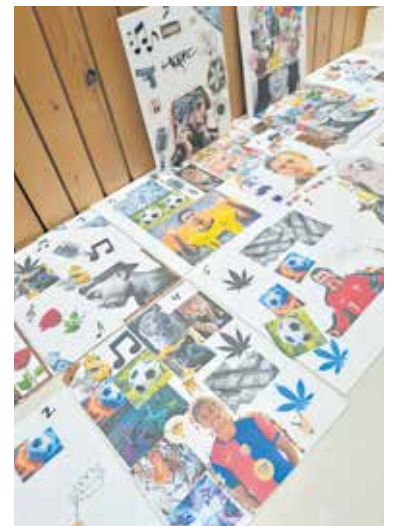
Expositie op school in Boxmeer.

Pro College Boxmeer-Stationsweg 38B Boxmeer tel. 0485-577459 (reserveren restaurant).