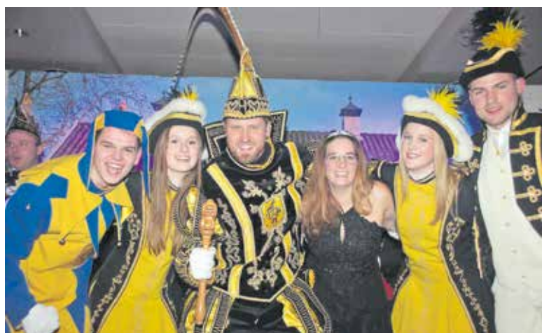
Hofhouding de Zelfkant Haps 2025.

CUIJK - Hier in de regio barst binnenkort het carnaval 2025 los. Hierbij een overzicht van de activiteiten van de carnavalsverenigingen in de oude gemeente Cuijk.