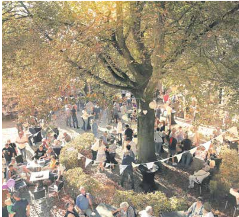
Het binnenplein van Tongelaar leent zich bij uitstek voor een bierfestival.