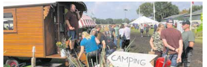
Altijd supergezellig in Wilbertoord.

Zelf meedoen? Deelname met oldtimer is kosteloos, voor de kofferbakverkoop betaald u slechts €15,- per verkoopplaats. Daarvoor krijgt u veel gezelligheid terug. Inschrijving kan via: www.wilbertoordpaktuut.nl . Voor meer informatie: peeltuffers@gmail.com