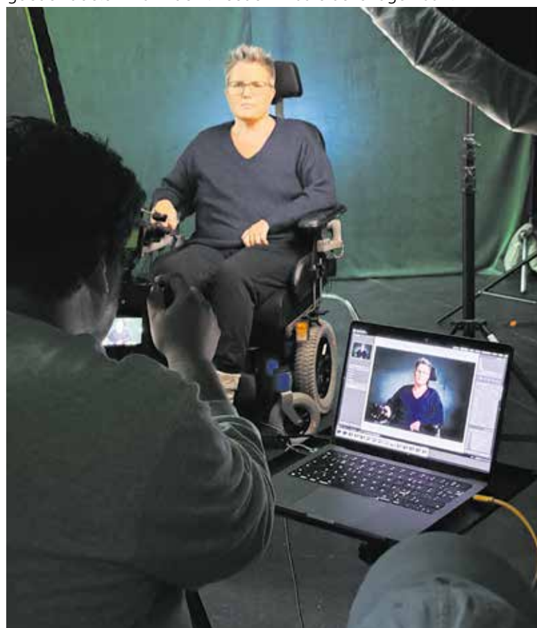
Juliette tijdens de opnames van de donatiecampagne.

Daarna heeft Nederland ongeveer een maand de tijd om te stemmen. Tijdens die uitreiking medio maart worden de winnaars bekendgemaakt.