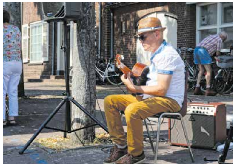
Eerdere editie van festival Cultuur aan de Maas.

"Wij zien nu al veel deelnemers buiten Cuijk die graag hun beste beentje voorzetten op 1 september. Dat stemt hoopvol en is een opsteker om er een prachtige dag vol cultuur van de te maken."