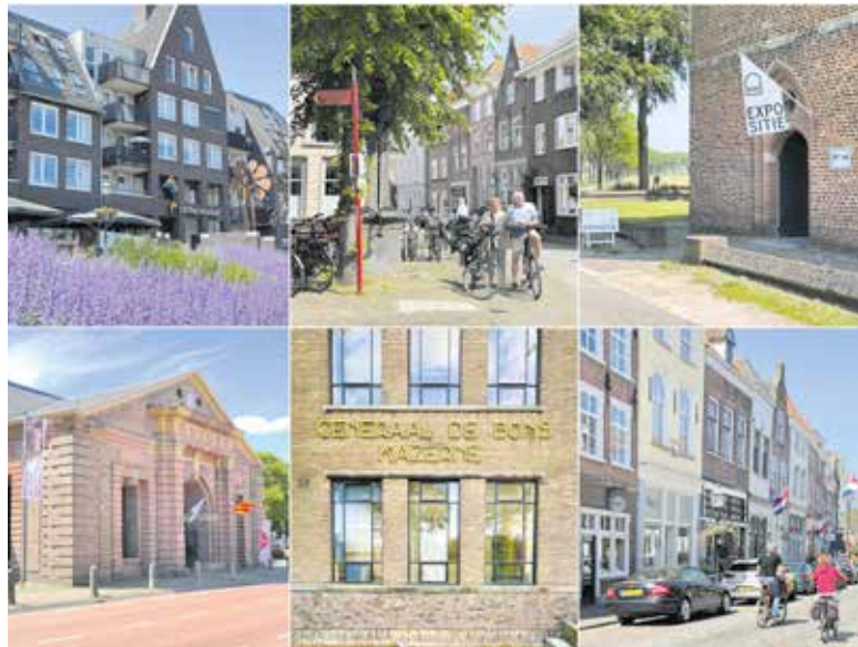
Een aantal van de locaties waar deelnemers aan de Graafse kunstfietsroute 'Over de Drempel' exposeren.

GRAVE - Stap op zaterdag 24 en zondag 25 augustus op de fiets en bewonder in Grave en omgeving de bijzondere kunstwerken van meer dan vijftwintig lokale kunstenaars. 'Over de Drempel' is de vijfde kunstfietsroute die in het kader van het Fietsfeest Land van Cuijk wordt georganiseerd.