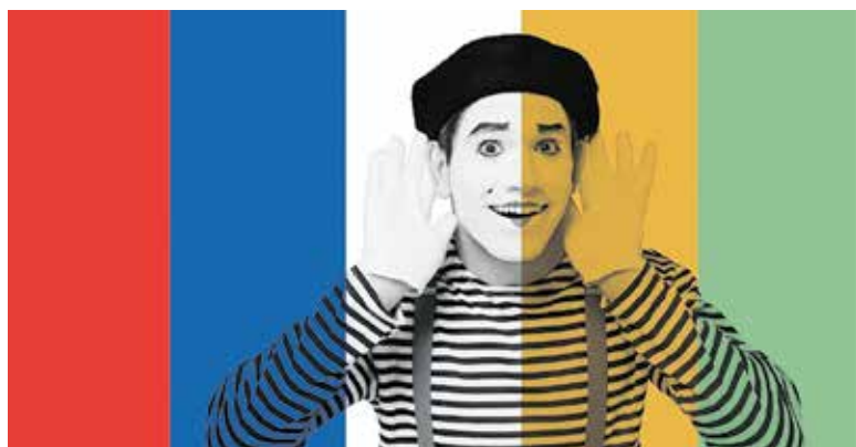
Nieuwsgierig naar het theaterseizoen: kom zaterdag 31 augustus naar Cuijk.