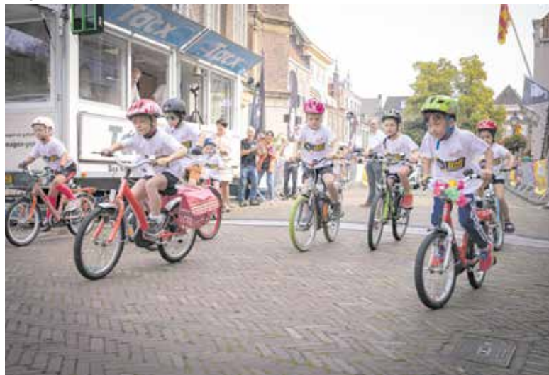
De Vestingronde in Grave afgelopen jaar.