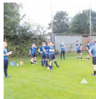
De eerste training van de Boxmeerse voetballers.

om 14.30 in Rhode tegen de gelijknamige club Rhode/VSB. Zondagmiddag 29 september volgt dan de eerste thuiswedstrijd van de competitie 24-25. Om 14.00 uur komt Heeze op bezoek in Boxmeer. Leden en supporters uit zijn benieuwd hoe Olympia'18 overzomerd heeft met een verjongde selectie.