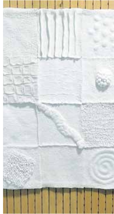
Textielkunst van Tjally Dirriwachter.

Meer informatie: www.kunstkring.com en www.karrespel.nl