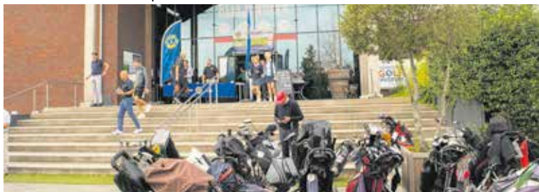
Golfen voor mooie projecten.