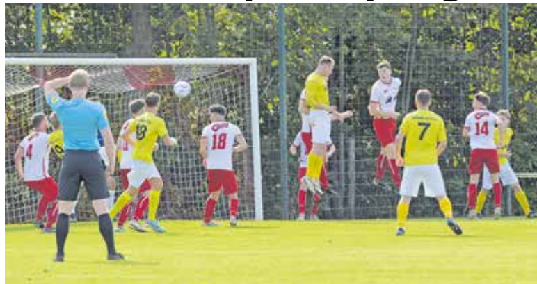
De derby Vianen Vooruit tegen HBV.