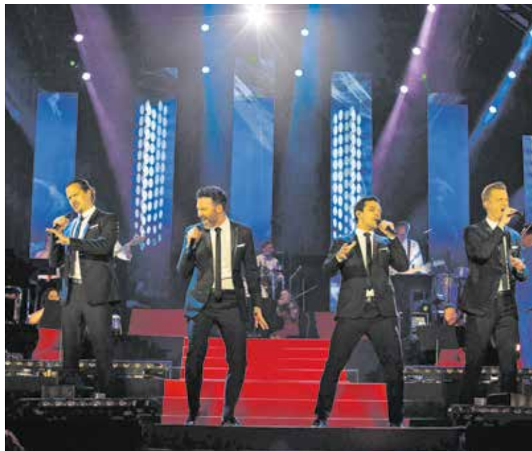
The Dutch Tenors staan 15 september in Schouwburg Cuijk.

Kaarten en informatie: schouburgcuijk.nl