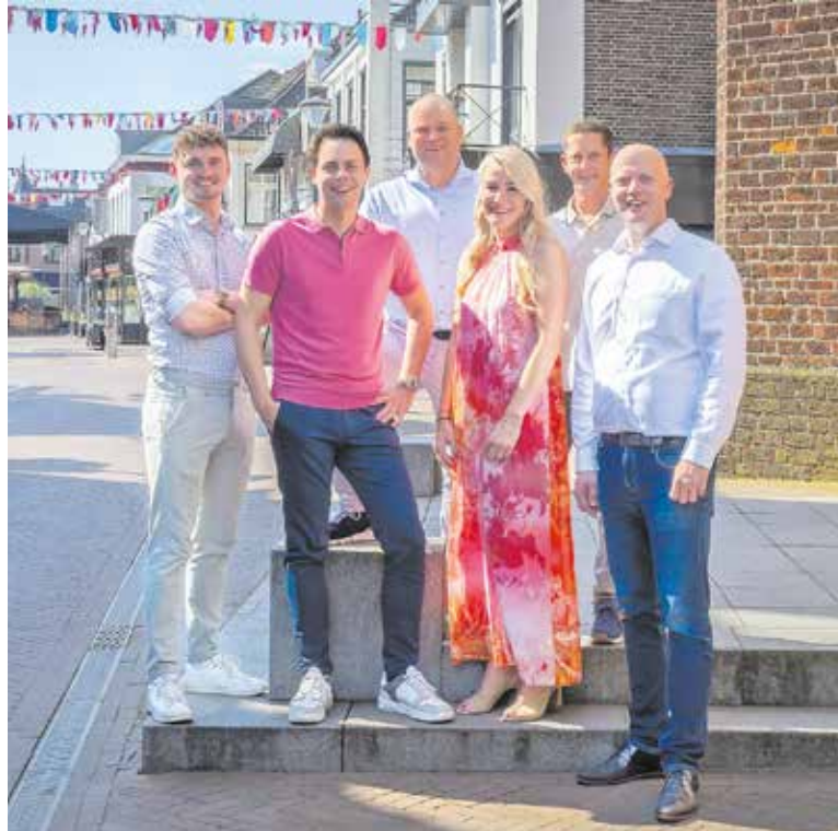
De genomineerden voor de ondernemersprijzen.