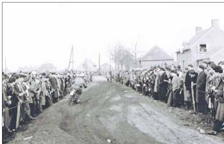
Motorcross in Sint Anthonis in 1957 met John Draper (GB) op zijn BSA -02.

De organisatie stelt het op prijs om u van te voren aan te melden via de website van Oelbroeck Sint Anthonis of via de QR code op de flyer in verband met de inventarisatie. De entree is gratis.