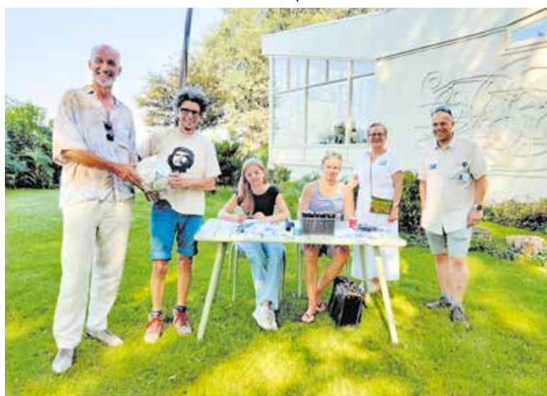
Volop activiteiten met kunstenaars tijdens Open Monumentendagen in Maashees.

Kijk voor meer info op www.luchtwachtorens.nl