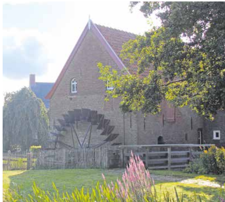
De watermolen in Oploo.

In het historische centrum van Grave rijdt op zondagmiddag een antieke postkoets (diligence) een gedeelte van de route die vroeger ook door soortgelijke koetsen werd afgelegd. Maar er is nog veel meer te doen in het Land van Cuijk. Scan de QR codes of kijk op openmonumentendag.nl