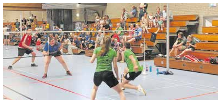
Recente werd het jubileumtoernooi gehouden van de 50-jarige vereniging uit Cuijk.

De trainingen zijn toegankelijk voor iedere leeftijd en niveau. Ontdek bij onze vereniging hoe leuk en gezellig badminton is en meld je voor 1 oktober aan! Kijk voor meer informatie en aanmelden op probeerbadminton.nu en zoek onze vereniging op!