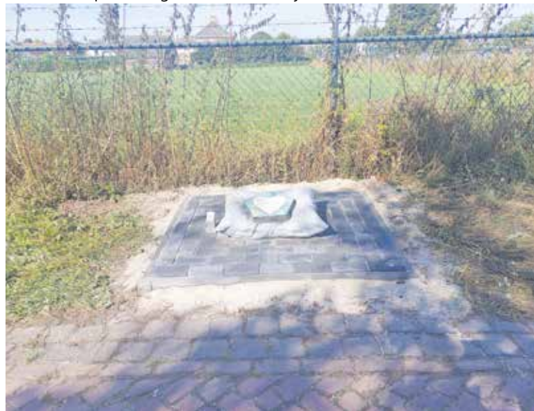
Het berrmonument in Oeffelt.

De berrmonumenten worden gemaakt in samenwerking met Lumiejère, een inventieve dagbesteding voor jongeren met autisme of ADHD. Deze samenwerking biedt hen de kans om via hun creatieve talenten bij te dragen aan een betekenisvol project. Het ontwerp, een ingedeukt kus-