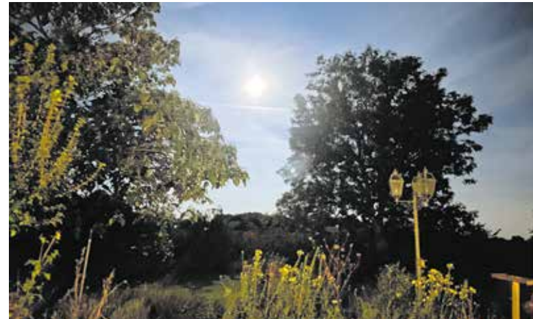
Wandeltocht in het donker tijdens Nach dan de Nacht.

GASSEL - Traditiegetrouw organiseren de Provinciale Natuur- en Milieufederaties elk jaar op de avond voordat de klok verzet wordt de Nacht van de Nacht. In 2024 is dat voor de twintigste keer op rij en wel op zaterdag 26 oktober.