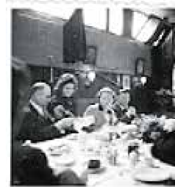
1946. Kroonprinses Juliana 'aan de Boxmeerse soep'.