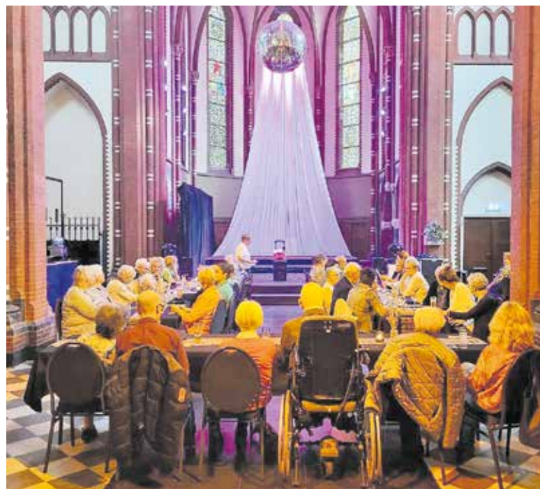
Muzikale middag voor bewoners uit Grave.

De Stichting tracht haar doelstelling te verwezenlijken door het ontwikkelen van en hulp te bieden aan lokale ideeën, initiatieven en projecten die zich richten op sociale en culturele ontwikkeling voor de plaatselijke gemeenschap. Met deze plaatselijke gemeenschap wordt niet alleen Beers bedoeld maar de gehele gemeente Land van Cuijk. Voorbeelden van de programmering van Stichting Keijla zijn de goede doelen en evenementen van KWF en Nederlandse Hartstichting, korenslag en orgelconcerten, ouderen bijeenkomst, repetitieruimte voor diverse zangkoren, gospelconcerten, tentoonstellingsruimte voor kunstenaars en fotografen en overige activiteiten die in een buurthuis plaats kunnen vinden.