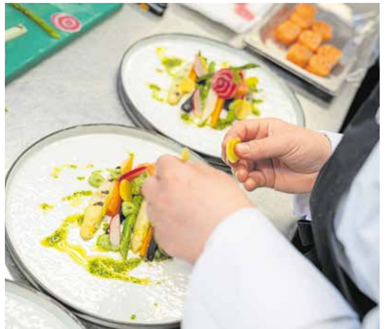
De koksopleiding in Cuijk.