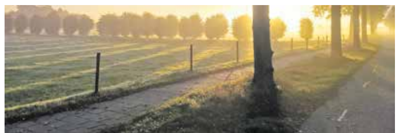
Wandelen door de omgeving van Oeffelt.

20 en 25 km, tot 10:00u. Vanaf 10:00u kan er gestart worden voor de 5 en 10 km, tot 12:00u. Betalen kan contant of met pin. Onderweg zijn er uiteraard pauzeplekken, waar wandelaars een kopje koffie en iets te eten kunnen nuttigen en even uit kunnen puffen. Alle routes zijn uitgezet met pijlen en daarnaast krijgen de deelnemers een volledig uitgestippelde routebeschrijving mee. De tocht leidt de wandelaars door een afwisselend landschap, zoveel mogelijk over wandelpaden. Iedereen, van jong tot oud is welkom. Voor de jeugd is er zelfs nog een medaille te verdienen.