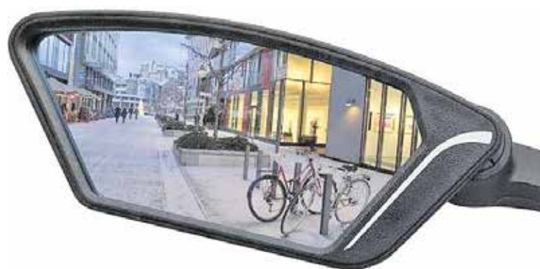
Een fietsspiegel ophalen op donderdag 17 oktober in Cuijk.

En die belangstelling is alleen maar fijn, want hoe meer mensen een spiegel gebruiken, des te veiliger wordt het verkeer voor iedereen! Komt u ook?"