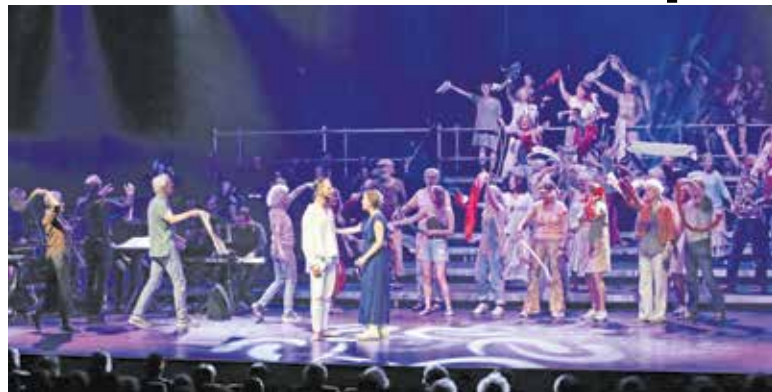
Eerdere voorstelling van SentoVero.