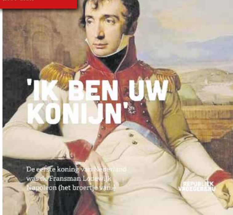
Koning Lodewijk Napoleon (1806-1810)

De eerste koning van Nederland was de Fransman Lodewijk Napoleon (het broertje van...)