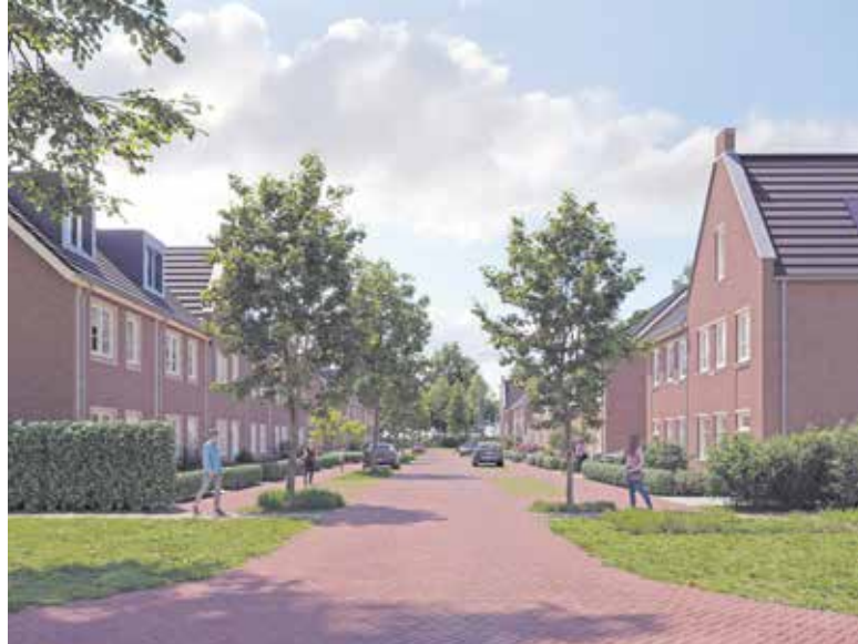
Fijn wonen straks in Bosrijk Mariëndaal.

VELP - Het is zover. De verkoop van de woningen in de bosrijke omgeving rondom klooster Mariëndaal start donderdag 17 oktober officieel. Wie deze prachtige locatie kent, weet hoe magnifiek wonen en leven in dit stukje Velp is.