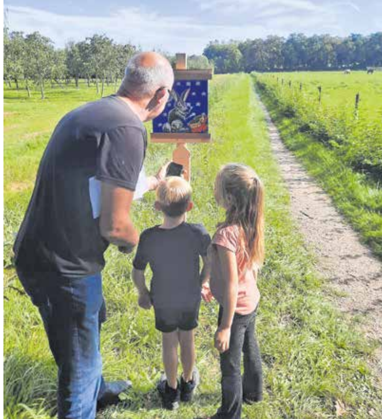
De Irenemars vorig jaar.

BEERS - Op zondag 20 oktober vindt de traditionele Irenemars plaats. Vier routes die door de prachtige natuur nabij en in ruimere omgeving van Beers lopen. De wandelmars is georganiseerd door en komt ten bate van harmonie Gaudete.