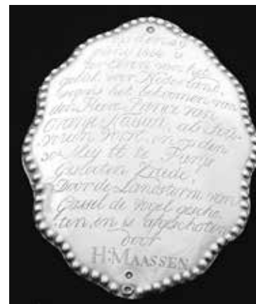
1814. Gassels zilveren koningschild.