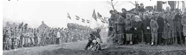
De Internationale Motocross Sint Anthonis in maart 1957.