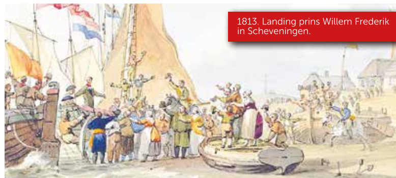
1813. Landing prins Willem Frederik in Scheveningen.