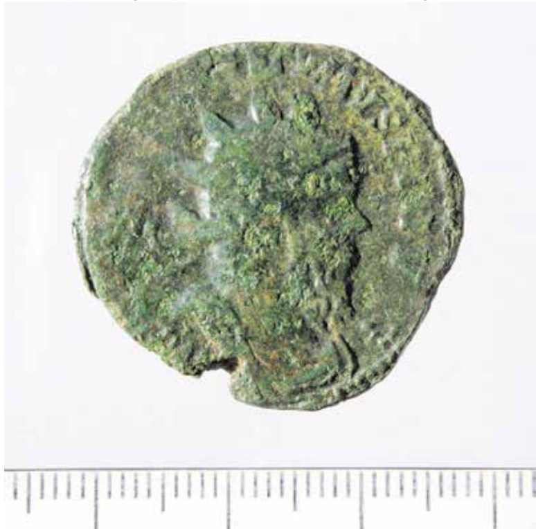
Munt uit de tijd van keizer Postumus.

De tentoonstelling over de Romeinse weg van Katwijk tot Maashees in het Land van Cuijk en de vondsten van overblijfselen van mammoeten en neushoorns uit de Kraaienbergse plassen in Cuijk en haaiantanden en andere overblijfselen van prehistorische dolfijnen en andere uitgestorven dieren die zijn gevonden in de Kuilen Mill/Langenboom, zijn nog te bewonderen in het Archeologisch Centrum Cuijk, Maasstraat 17. Vrij entree.