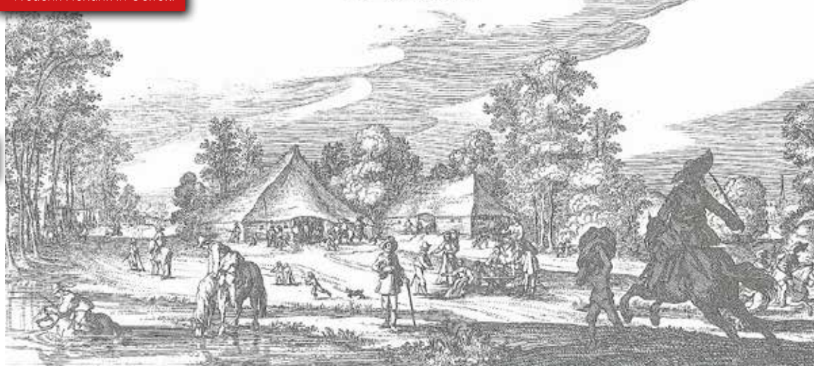
1642. Logement Frederik Hendrik in Oeffelt.