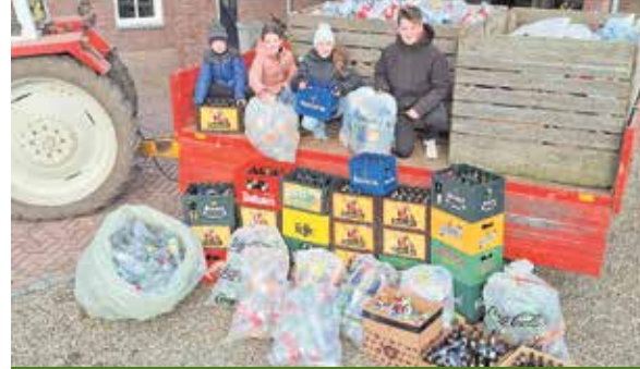
Opbrengst Alpe d'HuZes p.11

vrijdag 7 februari 2025 editie 601 jaargang 14