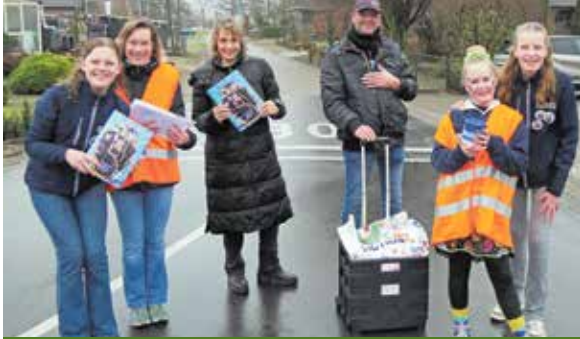
Nieuwe Bokkenblad! p.3

Huis-aan-huis krant met nieuws voor en door inwoners van Wilbertoord, Langenboom, Sint Hubert en Mill