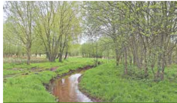
Wandeling Groespeel p.16

vrijdag 21 maart 2025 editie 607 jaargang 14