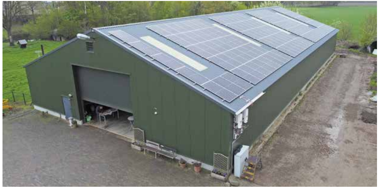
In Sambeek is al een energie coöperatie, waarbij inwoners gezamenlijk het dak van een stal benutten om zonne-energie op te wekken.

De subsidie bedraagt maximaal € 7.500,-. Dit kan besteed worden aan zowel de oprichting van een energie