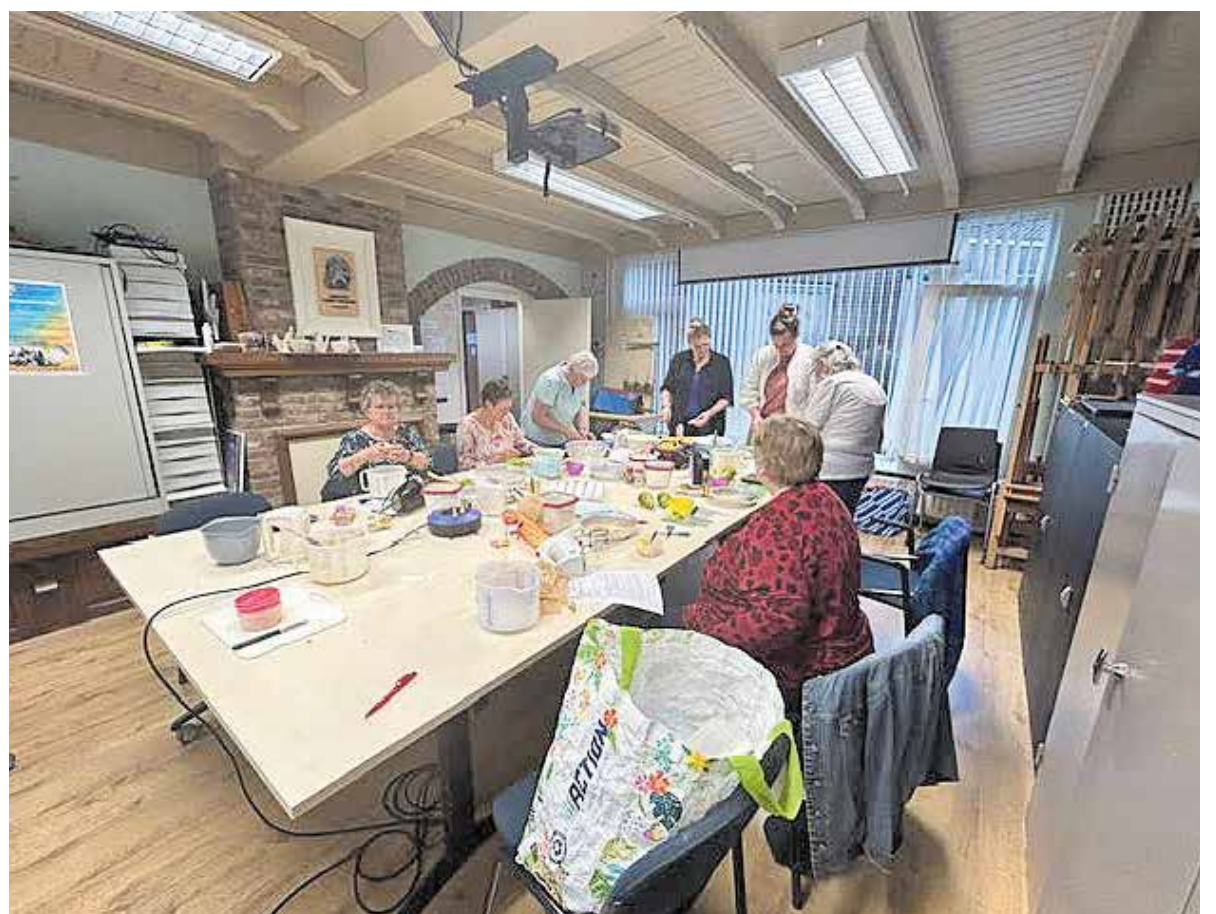
Hobby taarten maken en decoreren

Dit zijn de Pop-ups die wij Zin om mee te doe, geef je nu op aanbieden: bij de ledenadministratie van het 2024 HCM. info@hobbycentrummill.nl 2 Sept.-7 Okt. Maandag nl Let op : Vol is Vol. Iedereen is Tijd 19.30 uur Haak maar aan welkom , jong en oud. (Amiqurumi) 4 Sept.-9 Okt. Woensdag