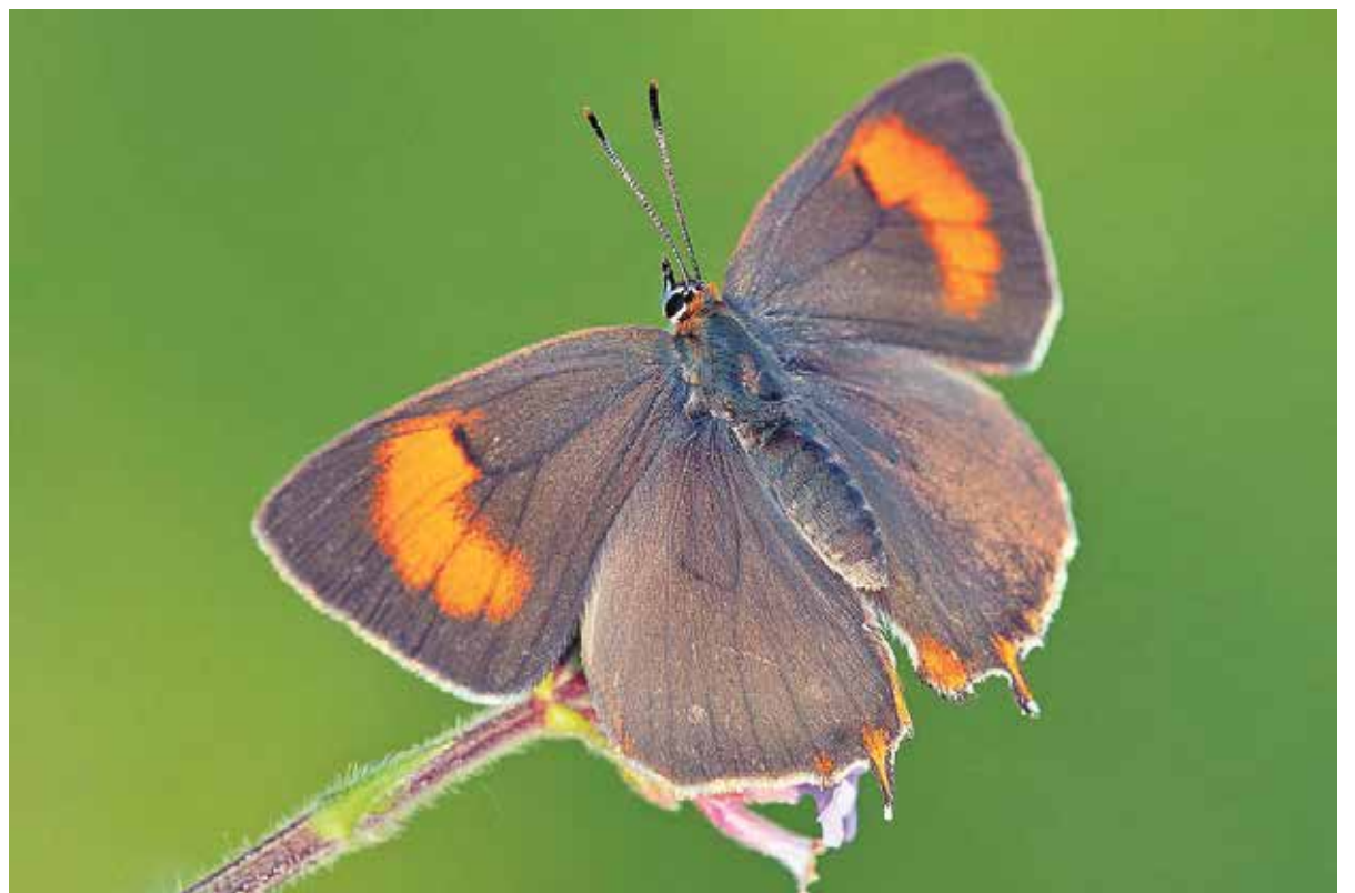
Sleedoornpage ( Thecla betulae ). Zeldzame vlindersoort die nog voorkomt bij de Kraaijenbergse Plassen en robuuste verbindingen erg nodig heeft.

de natuur over het algemeen op een robuuste manier worden langzamer reist dan de mens, kun verbonden met elkaar. Niet zomaar je gerust stellen dat de natuur echt een lijntje op de kaart, maar echte moet kunnen 'leven' tijdens die 'levensaders'. Brabants Landschap, reis, niet alleen de boel uitzitten de gemeente Land van Cuijk, Daarom is het zo belangrijk dat Waterschap Aa en Maas en andere organisaties zoals de ZLTO zien dat natuurgebieden, die te koesteren steeds duidelijker in en geven daar bakens van biodivers en rijk leven, echte vorm aan. Zodat de natuur