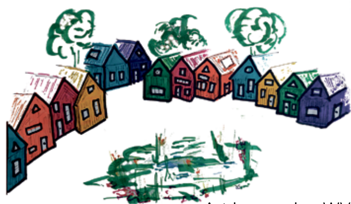
Art impression WV

We beantwoorden graag je vragen via welkom@kanderhof.nl of bel naar Wim Verbruggen : 06 – 22 11 40 49 Trudy van den Broek: 06 – 44 30 14 10