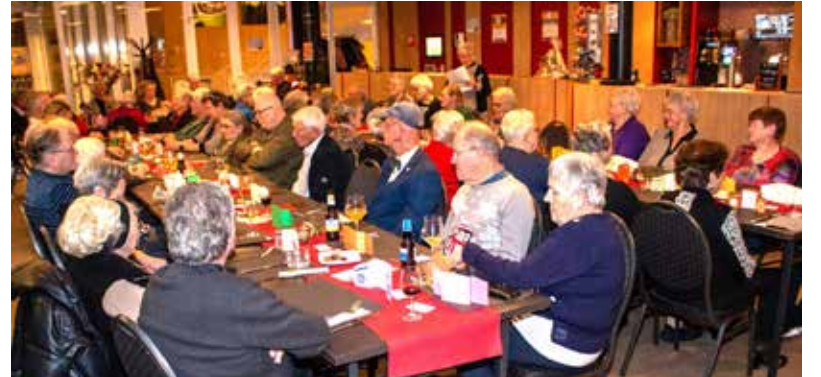
op iedere 4e woensdag van de Foto: Kerstdiner 2023 gemaakt maand. Voor de prijs van € 20,00 door Hen Daams kunt u genieten van een gevarieerd 3 gangenmenu incl. drankje.

Samen Eten op woensdag 18 december staat in het teken van kerst. In een mooi versierd Myllesweerd wordt er een kerstdiner geserveerd voor € 22,50 incl. drankje. U kunt zich opgeven tot en met de maandag voorafgaande aan het eten op het kantoor van Welzijn Ouderen Mill in Myllesweerd. U bent van harte welkom vanaf 17:00 uur. Aanvang diner is om 17:30 uur.